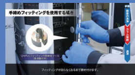
「HPLC カラムの取付方法」