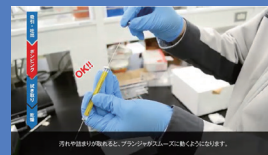
「マイクロシリンジの洗浄方法」