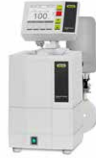
インターフェイス溶媒回収セット V-103