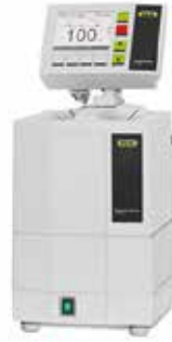
インターフェイスセット V-102