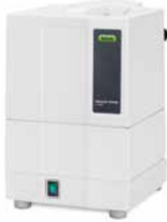
ダイアフラム真空ポンプ V-100