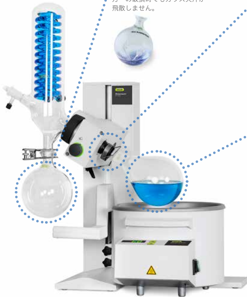
ロータリーエバポレーター R-100