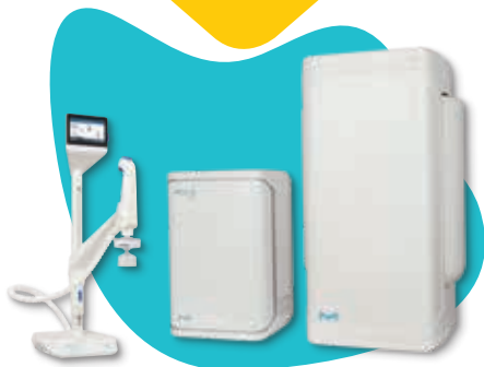
Milli-Q IQ 7003/05